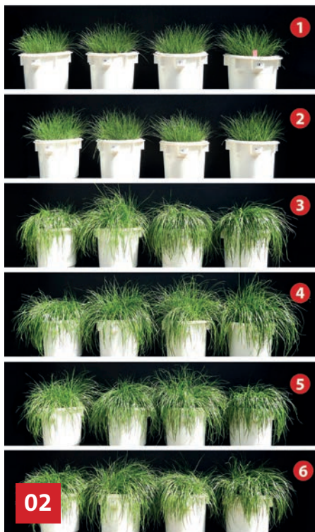
02 Die PHOS4green-Dünger (3–5) und handelsübliches Triplesuperphosphat (6) erzielen vergleichbare Ergebnisse; die Pflanzgefäße der Reihe 1 enthalten ungedüngtes Substrat, Reihe 2 wurde mit Rohphosphat gedüngt

gesetzt werden. Bei Bedarf lassen sich zusätzliche Phosphatquellen einbinden. Die Suspension wird im Wirbelschichtgranulator versprüht, wo sie auf ein Wirbelbett aus fluidisierten, arteigenen Partikeln trifft. Diese Granulationskerne werden im Prozess selbst generiert – entweder durch Abrieb oder durch verdüστε Tröpfchen, die die fluidisierten Partikel im Wirbelbett